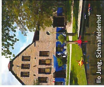
Ilo Jung, Schmalfelderhof

10000 Quadratmeter, parkähnlicher Garten mit altem und neuem Baumbestand, neuer Spiegeltisch und Skulpturenpark