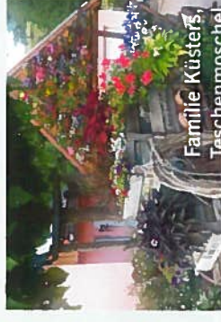
Familie Küsters, Teschenmoschel

Ehemaliger Schulgarten mit Rosen und kleinem Nutzgarten. Mitten im Ortskern der kleinen Gemeinde Schweinschied unterhalb des ehemaligen Schulgebäudes gelegen.